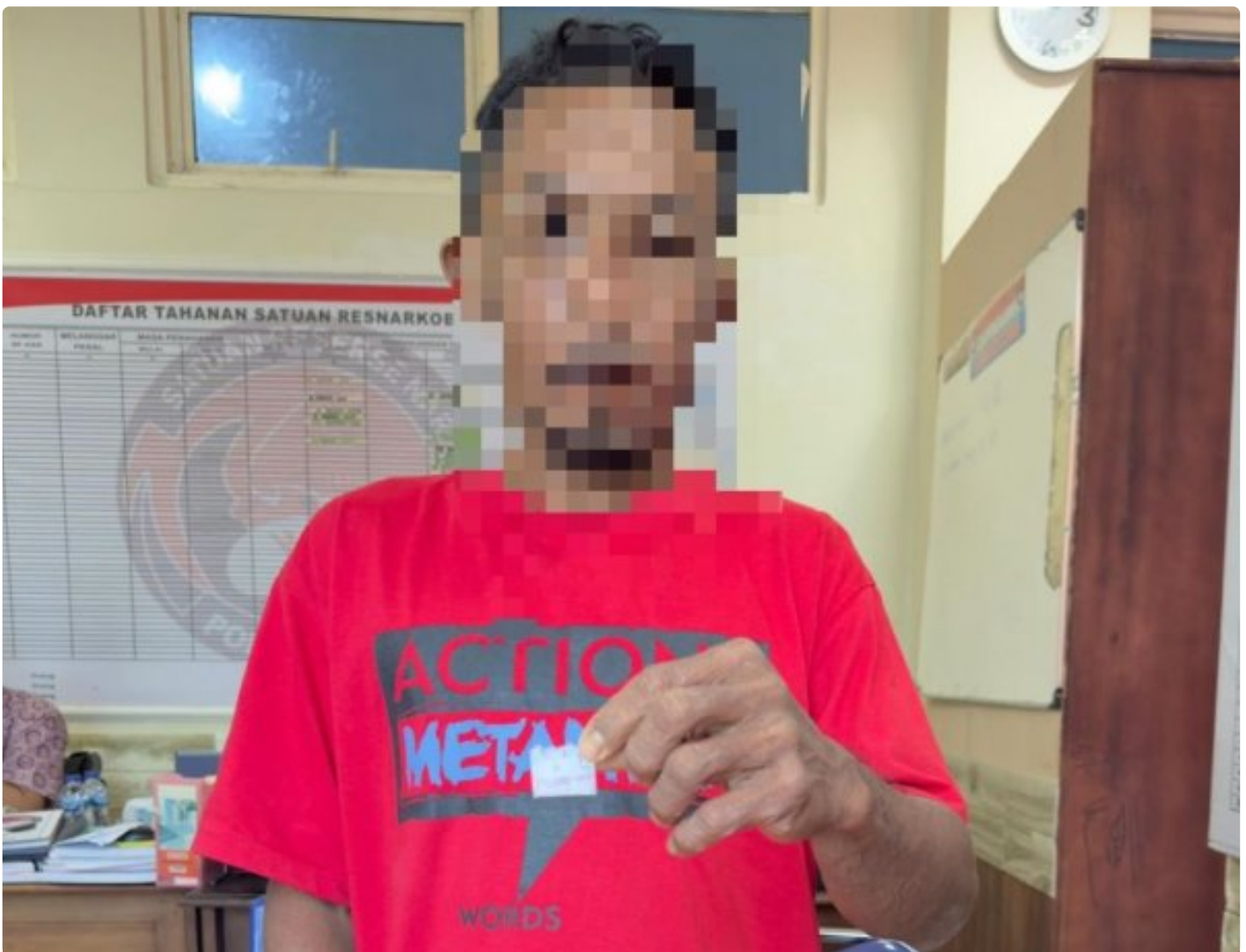
Pelaku Penyalahgunaan Narkotika jenis sabu diringkus dari Desa Lele

MOROWALI, Sulawesi Tengah- Satuan Reserse Narkoba (Satresnarkoba)